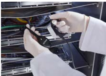
RFID-skanner för ökad säkerhet