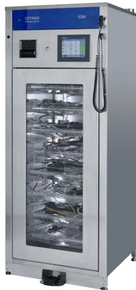
Getinge EDS8 tork- och förvaringsskåp