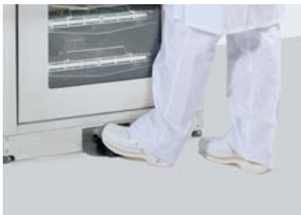
Fotpedal för bekväm manövrering med fria händer