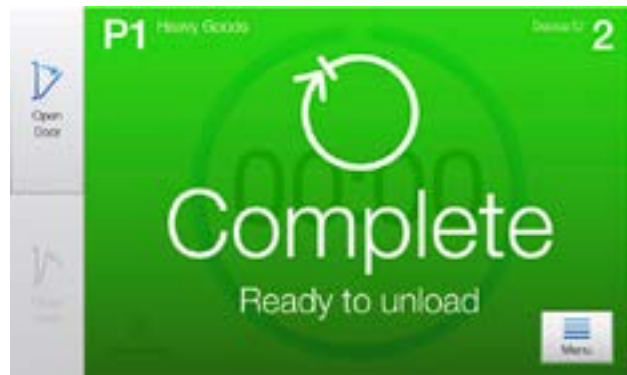
CENTRIC-käyttöliittymä tarjoaa selkeän, tarpeettomista tiedoista vapaan tiedon – vain sen mitä normaalisti tarvitset kussakin vaiheessa, ei mitään muuta.