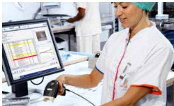
T-DOC-järjestelmän ansiosta mikään ei enää katoa.