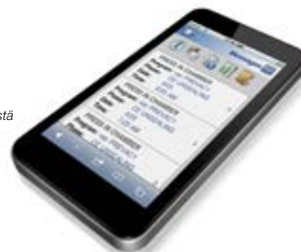
Tarkastele tietoja 30 viimeisestä sterilointilaitteprosessista missä tahansa välinehuollon sisällä tai ulkopuolella.