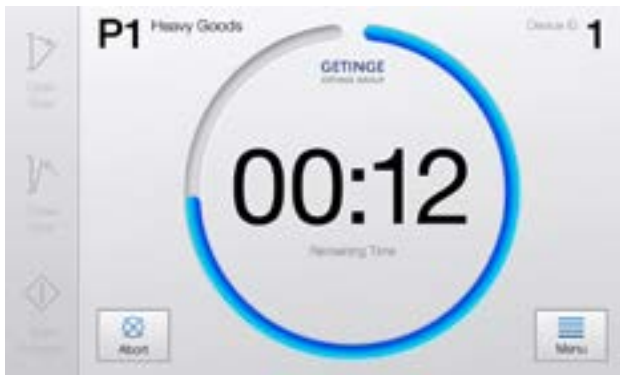
Tila yhdellä silmäyksellä. Jäljellä oleva aika on helppo nähdä, jopa matkan päästä.

Suuret, korkearesoluutioiset näytöt ovat helppolukuisia, minkä ansiosta henkilökunta näkee tilan ja voi seurata sitä etäämmältä, mikä parantaa käyttäjätuottavuutta ja tuottavuutta. CENTRIC-käyttöliittymän ansiosta Getinge ottaa jälleen valtavan edistysaskelen innovatiivisten, integroitujen ja käyttäjäkeskeisten ratkaisujen toimittamisessa.