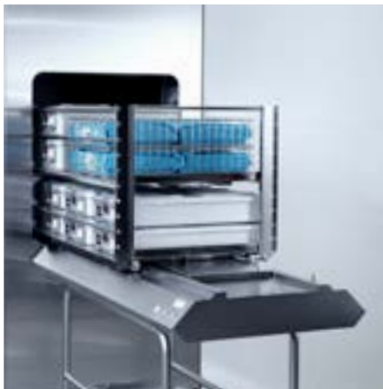
Hyllytelneiden automaattinen täyttö-/tyhjennyslaite (GL64SR).

Getingen automaattinen täyttö-/tyhjennyslaite GL64 on täysautomaattinen järjestelmä Getinge GSS67H -sterilointilaitteen täyttämiseen tuotteilla / laitteen tyhjentämiseen. Järjestelmä optimoi tavaroiden käsittelyn ilman, että käyttäjän tarvitsee suoraan valvoa sitä. Automaattinen täyttö-/tyhjennyslaite mahdollistaa henkilökunnan ergonomisen työskentelyn, sillä tavaroiden manuaalinen käsittely jää pois.