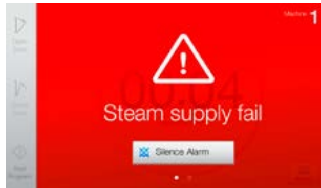
Annetun hälytyksen yhteydessä näyttöön tulevat aina selkeät ohjeet, joiden mukaan tulee toimia. Ei sekaannuksia, ei stressiä, ei hukattua aikaa.