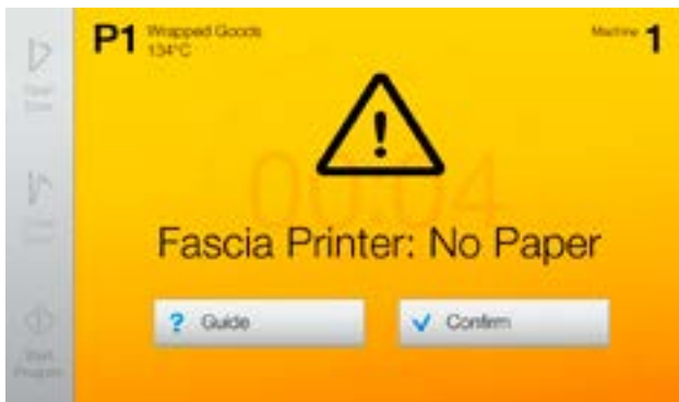
CENTRIC-käyttöliittymä tarjoaa helposti ymmärrettävän käytönaikaisen tuen ongelmien ratkaisuun ja lisätoimintojen käyttöön.