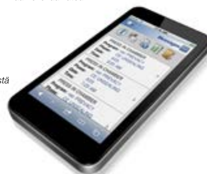
Tarkastele tietoja 30 viimeisestä sterilointilaitteprosessista missä tahansa välinehuollon sisällä tai ulkopuolella.