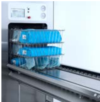
Korien automaattinen täyttö-/tyhjennyslaite (GL64B).